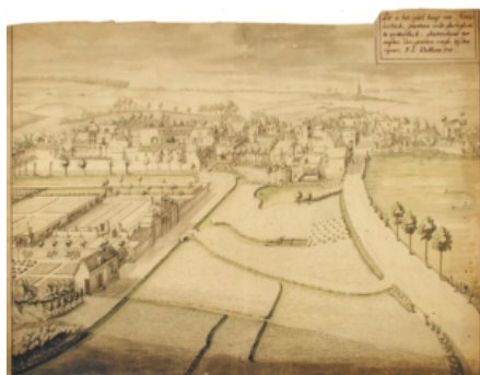
Eggevoort, Hans Collaert (vers 1600)