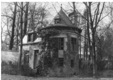
La Tour vers 1930