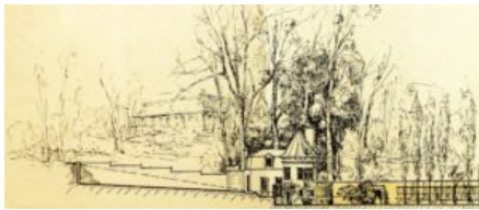
Relevé de la Tour et du terrain, 1924