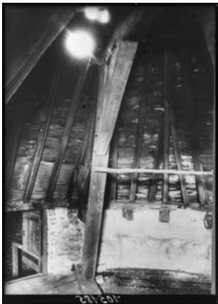
L'intérieur de la Tour, vers 1930