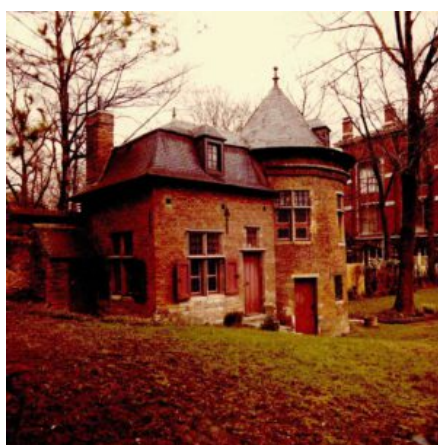
La Tour Eggevoort au début des années 1970