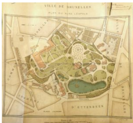
Plan du Parc Léopold, 1907